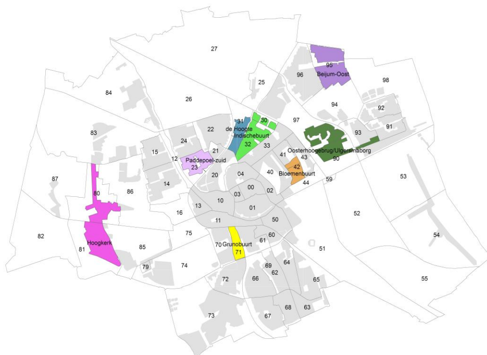
Figuur 1b Gebiedsindeling, de 8 buurten