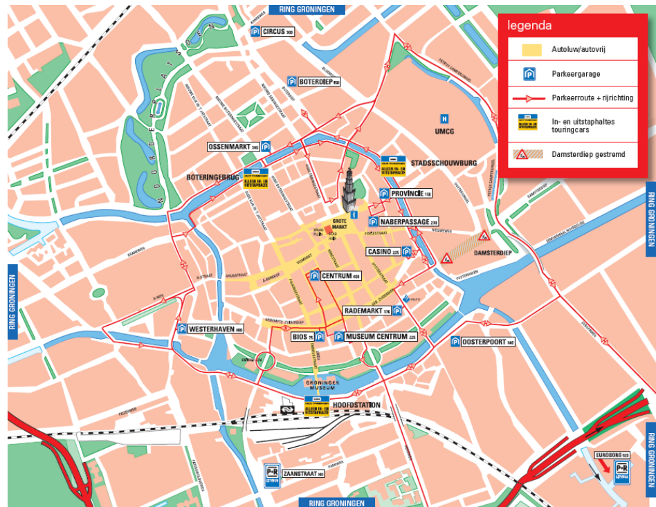
Afbeelding 2.1 Locaties parkeergarages